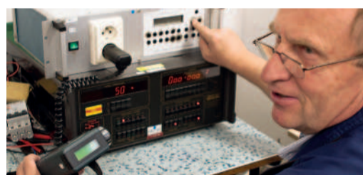
Firma s lidskou tváří